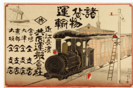
近江長浜 共同運搬会社引き札

明治4年(1871)には県下初の小学校が創立され、明治10年(1877)には国立銀行が設けられました。明治15年(1882)に鉄道が開通し、さらにそれにともなって琵琶湖を鉄道連絡船が運航することにより、長浜は近代交通の要所となりました。郡役所や郵便局などの近代的な公共施設もあいついで整備され、長浜はめざましい変貌をとげていきました。