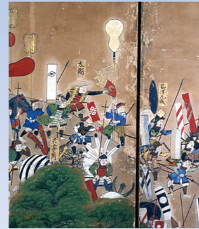
賤ヶ岳合戦図屏風(右隻部分) 秀吉本陣

湖北は、室町時代から安土桃山時代にかけて、織田信長、豊臣秀吉の天下統一への戦乱のなかに巻きこまれていきました。とくに長浜は、秀吉が一国一城の主となった最初の拠点であり、彼の城下町経営の基本パターンを醸成したところでもあります。