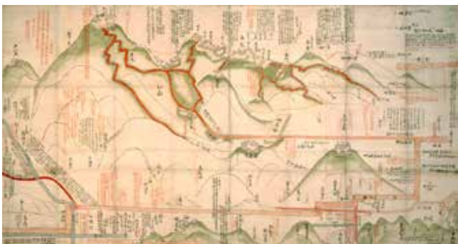
▲小谷城跡絵図 小谷城址保勝会蔵【長浜市指定文化財】

小谷城跡は昭和12年4月に本丸跡等の山城部分 が国の史跡に指定され、平成7年2月には浅井氏と その家臣団の屋敷があった清水谷地区が追加指定を受けました。