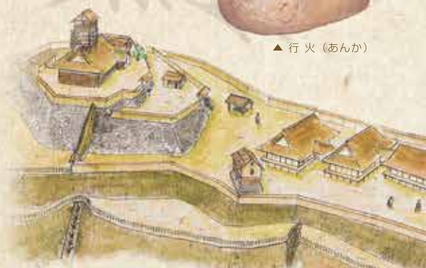
▲小谷城曲輪 復元イラスト (中井均監修)

※出土品はすべて長浜市教育委員会保管 ※掲載の出土品は展示替え等により異なる場合があります。